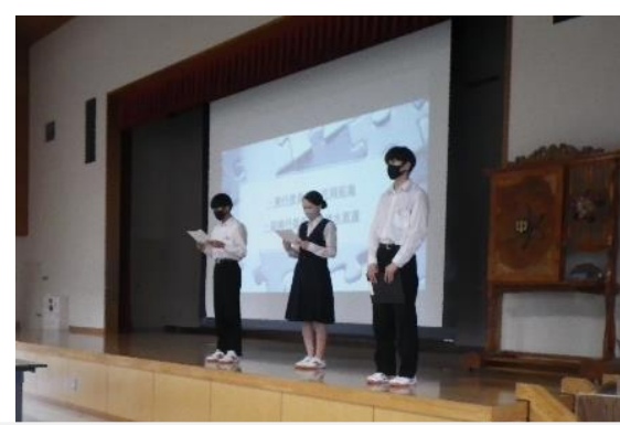
第1回筑北祭集会(スタート集会)の様子